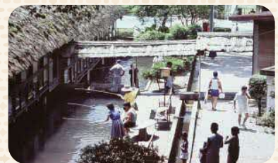
観光客で賑わう養魚場