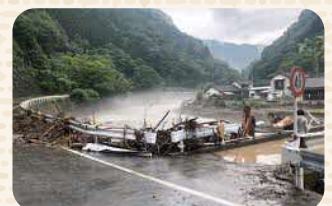
令和2年7月豪雨災害発生