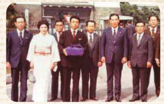
栗献上 皇居にて (昭和52年9月27日)