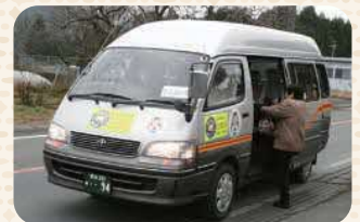
まるおか号運行開始