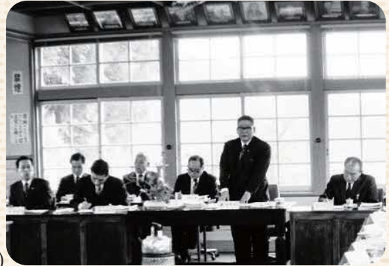
旧庁舎での議会の様子