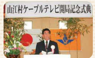
山江村ケーブルテレビ開局記念式典