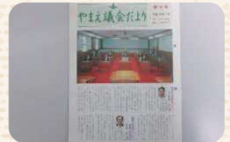
議会だより創刊号