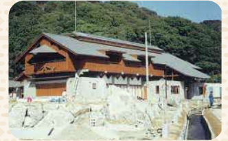
建設中の山江温泉健康センター