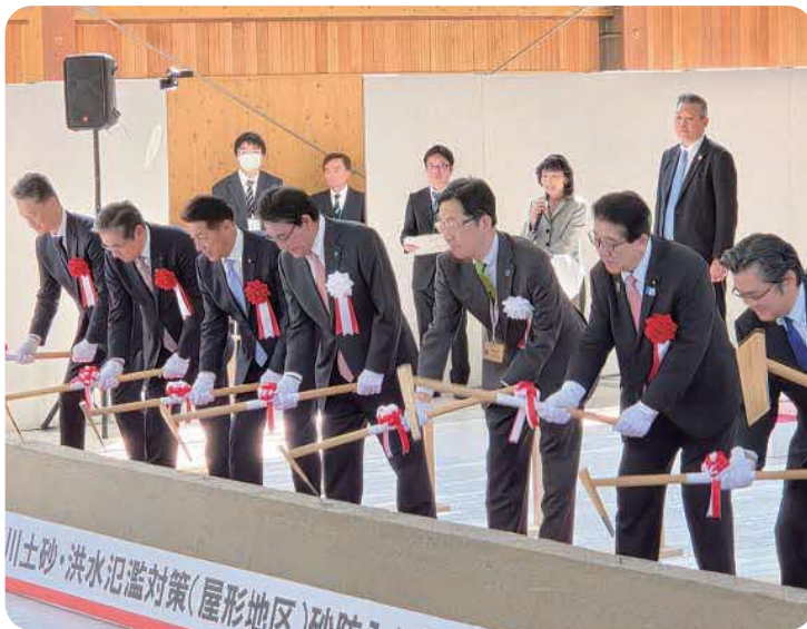
万江川土砂・洪水氾濫対策（屋形地区）砂防えん堤工事着工式

災害が語りかけてきたと ころでもあります。鎮山 親水には、そのふるさと への思いが込められてお ります。その実現に向け て、本年7月に執行され る山江村長選挙には、出 馬するという決意を固め たところであります。