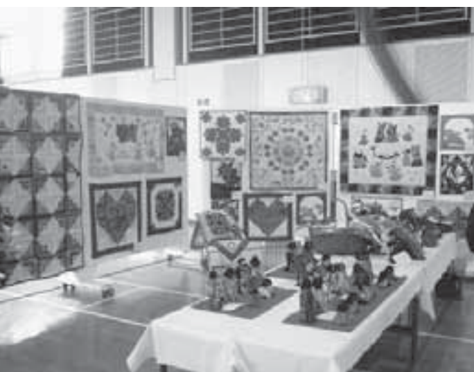
パッチワーク部の作品展示