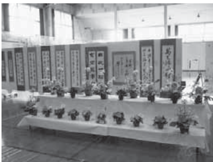
書道・フラワーアレンジ部の作品展示