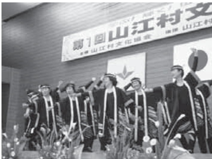
「九州まつり唄」レクレーションダンス