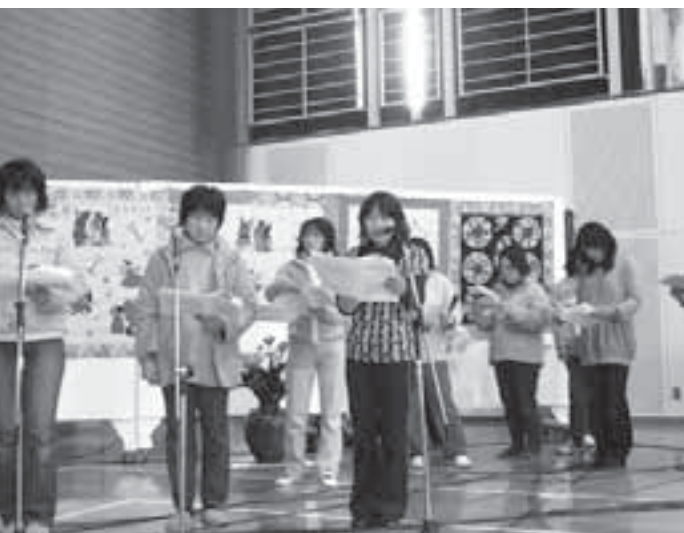
読み聞かせグループ（おひさま）の「おだんごころころ」