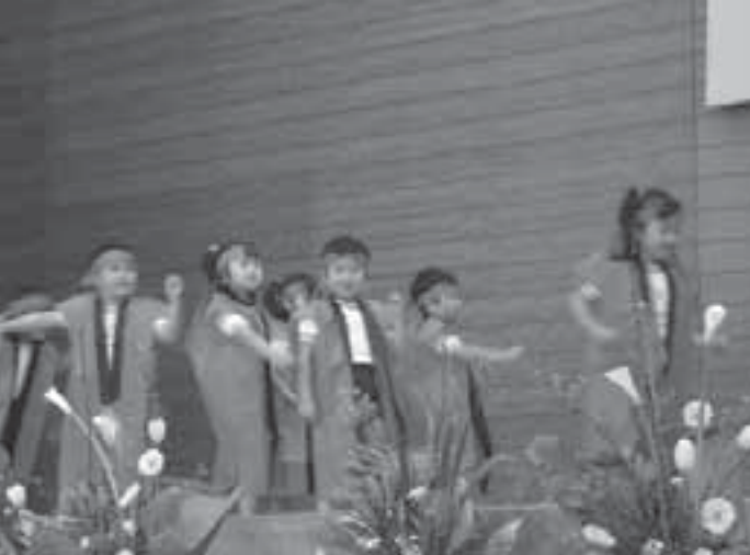
章鹿倉保育園の遊戯