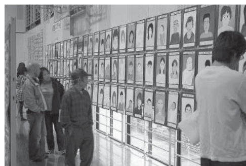
(ジュニアアート展)