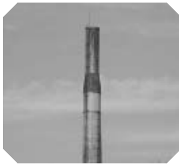
山江焼却場の煙突

また、東西に大きい道路も通っておりますし、車の通行量も多いところでございます。そのため、山江村に2基しかない信号機もこの9区に設置されているところでございます。それと、30年近く9区の内