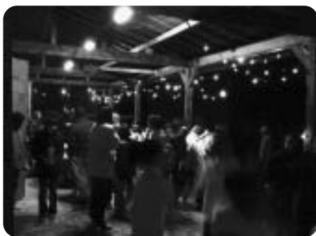
石倉のきれいなイルミネーション

外は寒く雪が散らつく中でしたが、石倉のステージでは流行のダンス、プロジェクトを使った読み聞かせ、手作りの大型の紙芝居、楽器の演奏等があり、子供から大人まで総勢約100名以上の方々が出演され熱気あふれるコンサートとなりました。