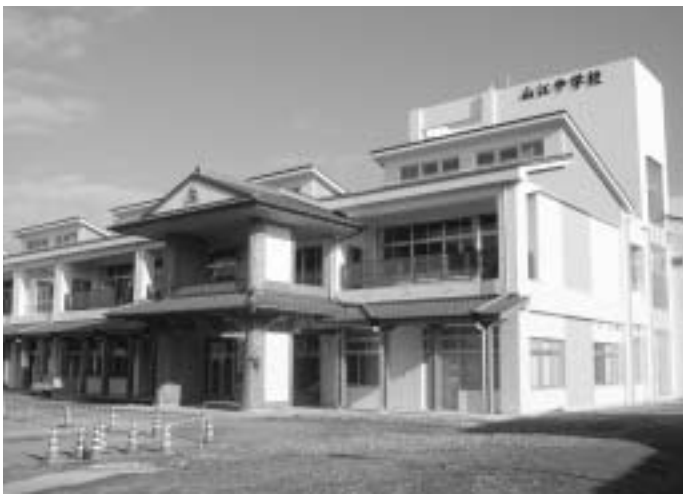
校舎棟玄関（南東側から）

そして、12月16日に清祓式を歴史をイメージさせる造りの正面玄関前で行いました。それぞれの挨拶では、「貴重な財源を投資し、建設された校舎です。この山江村から優秀な人材が育成されることを望みます。」とあ