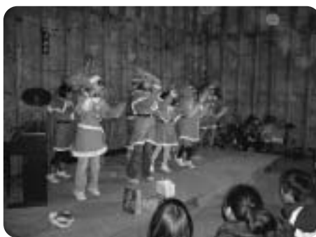
ゴリエキッズによるダンス