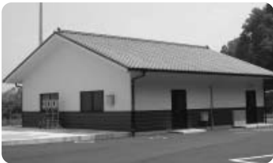
万江地区クリーンセンター