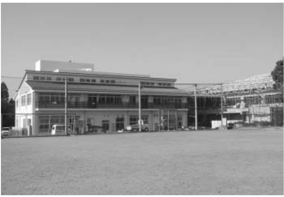
竣工した校舎と建設中の体育館

備（10kw）も設置します。今年2月下旬には竣工の予定です。そして、最終工事の外構工事が3月中旬に竣工したらすばらしい山江中学校が人吉盆地を望むこととなります。地域に密着した学校を目指しています。この春、ついでがあればご来校いただきますよう最後にお願ひ致します。