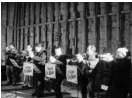
消防団ラッパ隊の演奏