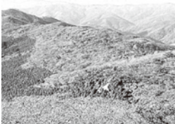
仰烏帽子山からの眺め

案内看板も設置しておりますので、是非新たな観光スポットとなった2箇所を訪れ、村の魅力を再発見してください!!