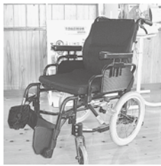
熊本安全センター様 ありがとうございます。