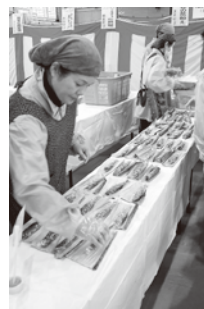
大好評だったヤマメの燻製

会と時代の駅のレストランやまのまんまがチームを組み、「地鶏鍋」や「ママの燻製」や「大根の寒漬」びっ栗だご汁」を出品しました。