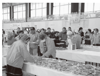
500人の来場者で溢れる

1月31日、「心温もる人吉球磨のごつつお満菜」と銘打った食の文化祭が山江村体育館で開催され、県内外から約500人の方が訪れました。