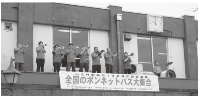
ラッパ隊によるファンファーレ