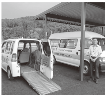
車椅子が乗車できる福祉車両

社協というのはまさしくそれを実現する機関ですので、大変プレッシャーも感じておりますが、村民の方々に貢献出来るという実感も大変感じるところです。民間で働いていたという視点を生かしながら、多様化するニーズにこたえられるように精一杯頑張りたいと思っています。