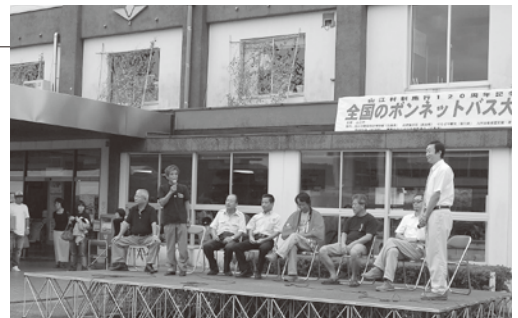
ボンバス関係者によるステージトーク

午前11時と午後2時には各5台ずつのボンネットバス体験試乗を行いました。乗車記念券を求めて1時間以上前から受付には100人を超す長い列ができ、並んだのに乗車記念券をもらえない人も。乗車記念券をもらった人は好きなバスに乗りこみ、20分程のバスの旅を楽しんでいました。