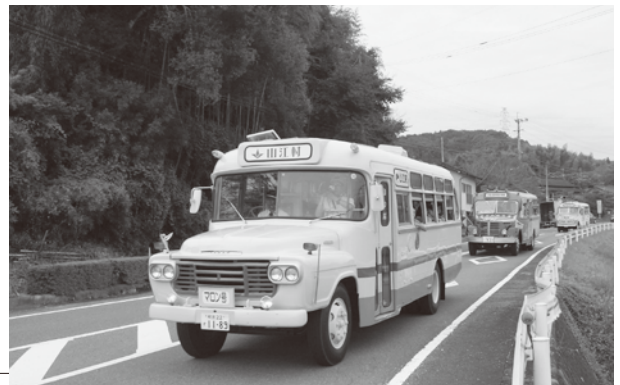
ボンバスの試乗体験

かしい、「かわいい」といった声がいちいち聞こえていました。会場には1万人を超す人が訪れ、うどんやヤマメ、加工品などあつという間に完売していました。