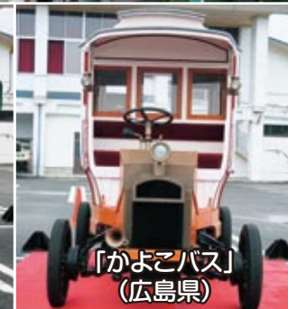
「かよこバス」 (広島県)