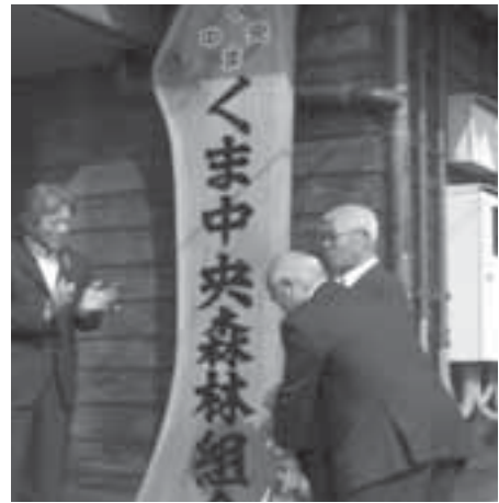
地元産木材に新名称を刻んだ看板がお披露目されました