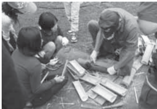
指導を受けながら、たかんぼ飯の用意をする児童たち

児童たちは竹箸作り、ヤマメの掴み取り、豆腐作り体験等を行いました。夜は尾寄崎キャンプ場で宿泊。季節の変わり目と、標高が高いため寒い夜を過ごした様ですが、2日間の体験を終えた児童たちは笑顔で帰っていきました。