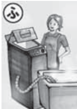
文：人吉球磨環境協議会 絵：球磨工業高校美術部

これから日増しに寒くなっていきますが、温かいお風呂は、一日の疲れを癒してくれます。入浴には、温熱作用・水圧作用・浮力作用の3つの効果があるといわれています。体を温めることで血行を良くして疲労回復やコリを和らげたり、水圧によって手足にたまった血液を心臓に押し戻したり、浮力によって体重を支えている筋肉や関節を休ませることができます。