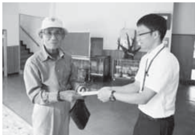
自然休養村管理センターにて(万江地区)

対象者の方からは、「ありがとう」や「長生きして良かったです。」という言葉が聞かれました。