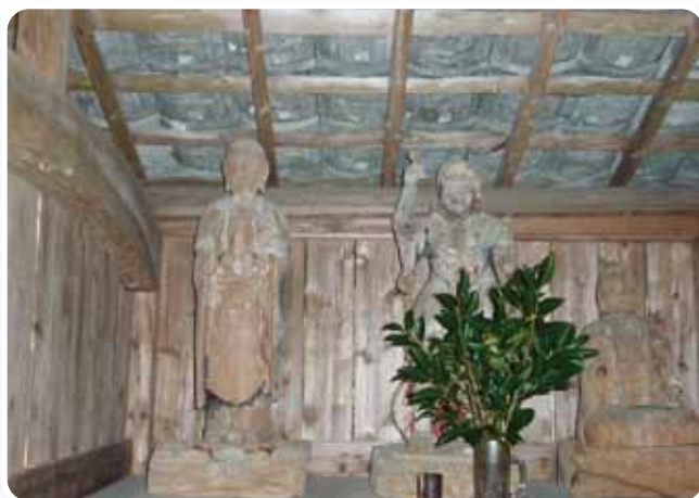
堂園地蔵堂堂内の仏様 (木造男女神像)