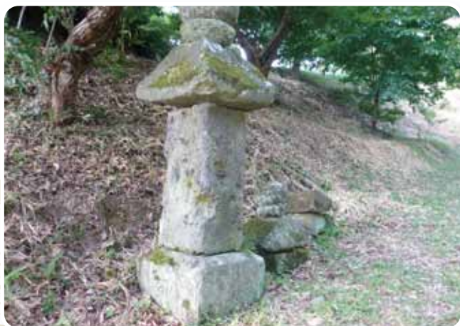
増大寺跡五輪塔群