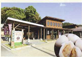
山江村物産館ゆっくり

旧村役場を改築したもので、昭和初期のイメージを残しています。1階はレストラン、2階は簡易宿泊所としても利用できます。