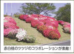
赤白桃のツツジのコラボレーションが素敵!