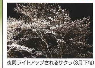
夜間ライトアップされるサクラ(3月下旬)