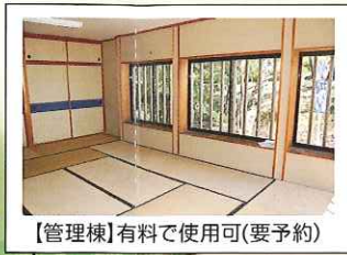
【管理棟】有料で使用可(要予約)