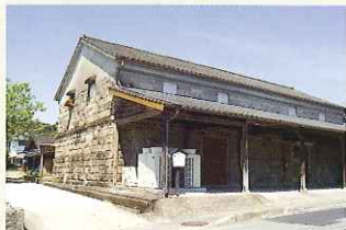
石蔵 (国登録有形文化財 JA球磨第26号倉庫)

体育館を併設している会議施設です。宿泊することも可能で、地域の会議や学校の合宿、キャンプなどによく利用されています。