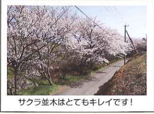
サクラ並木はとてもキレイです!