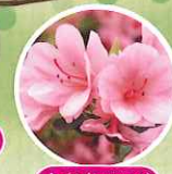
久留米ツツジ 4月中旬