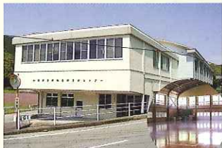
自然休養村管理センター

体育館を併設している会議施設です。宿泊することも可能で、地域の会議や学校の合宿、キャンプなどによく利用されています。