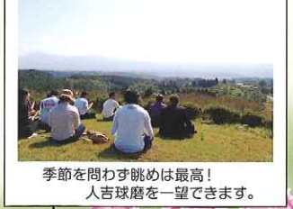
季節を問わず眺めは最高! 人吉球磨を一望できます。