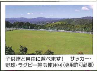
子供達と自由に遊べます! サッカー・ 野球・ラグビー等も使用可(専用許可必要)