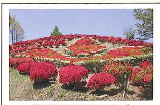
村の村草を形どったツツジ。