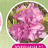
淀川ツツジ 4月下旬