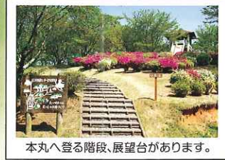
本丸へ登る階段、展望台があります。